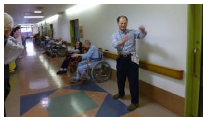
皆さんとラジオ体操を一緒に行います