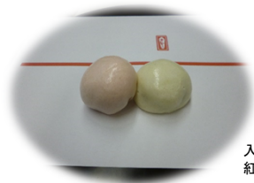
入所者様と 紅白まんじゅうでお祝い