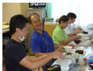
昼食は、職員とおしゃべりしながらとります。