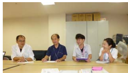
週に一度判定会議があります。活発な意見がでていました。