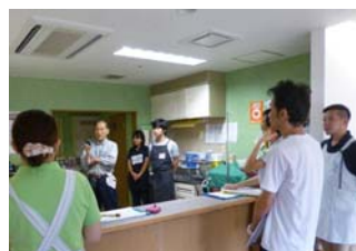
申し送り中。施設長も必ず毎日参加しています