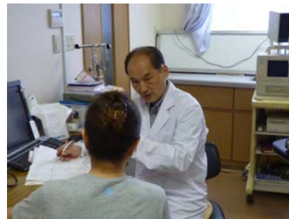
診療所スカイで診察中