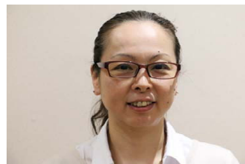
3階介護支援専門員