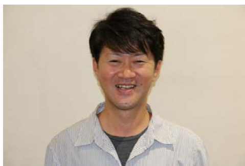
2階介護支援専門員