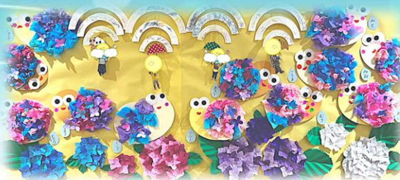
スカイ託児室作成 2023年6月撮影

その他にも、入所フロアでは季節ごとのイベントや日中に行われるレクリエーションでカラオケや、折り紙、塗り紙、カード合わせ等様々な楽しさをしております。