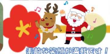
素敵な笑顔が満載です！